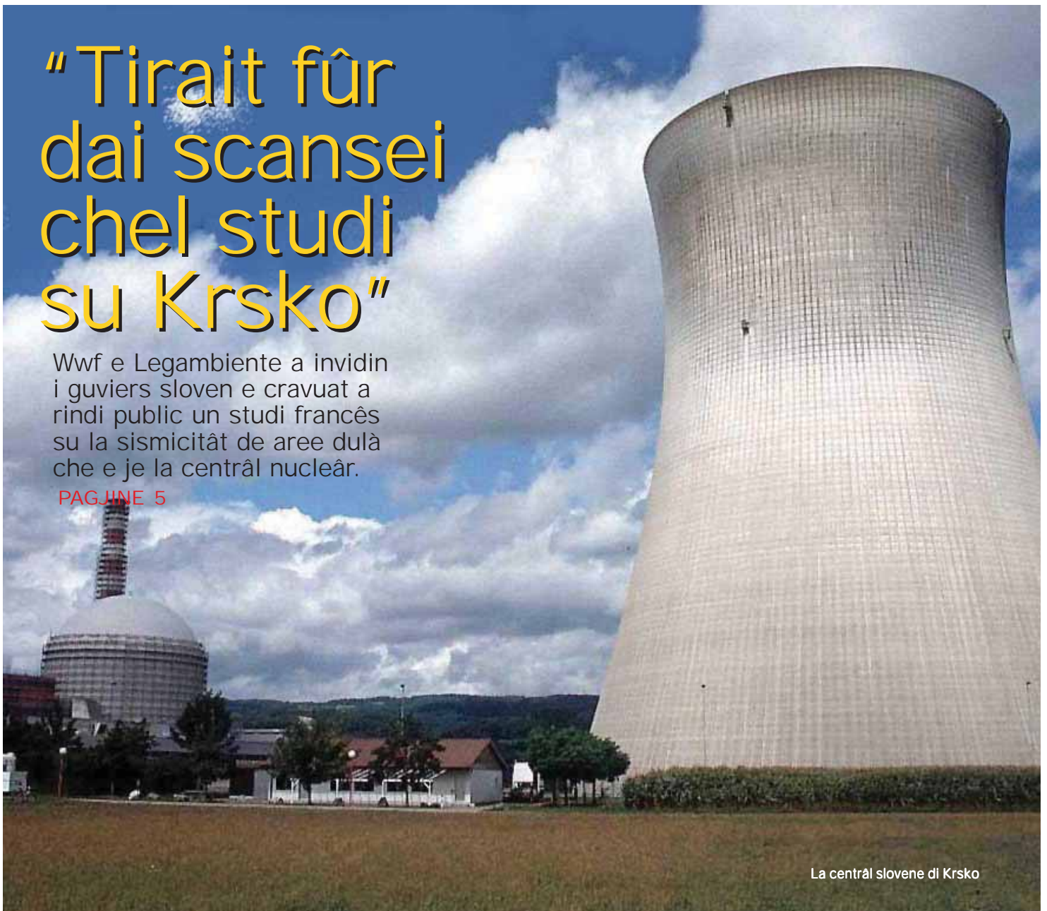
La centrâl slovene di Krsko