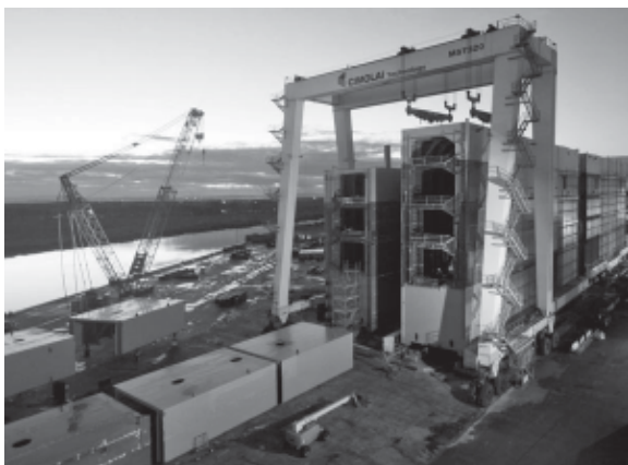
Fasint sù lis paradanis dal Canâl di Panamâ.

lôr bandis a son stadis trasportadis vie tiere e assembladis intal cantîr de "Gas&Heat", dongje di Livorno, a son un pôc plui pigulis (il lôr pès complessif al è su lis dôs mil toneladis) e a son stadis za metudis sul fonts marin, intune cuntune di chês altris dôs platformis che a completin il progjet e che a vegnin fatis de dite "Rosetti Marino" di Raven-