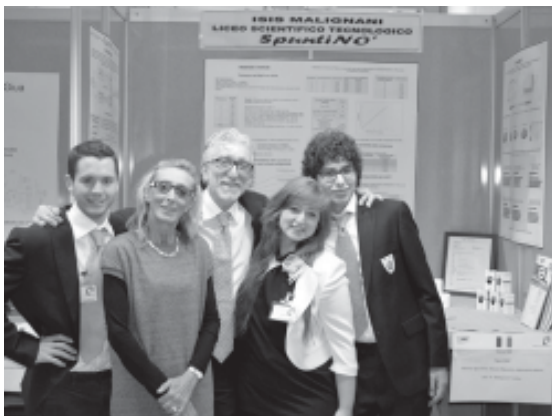
I trê students cui lôr professôrs

Vins blancs plensi di incjant e neris che a dan di maravee, cantinis piculis e graciosis di visitâ e puecj ospitâl dula che si pues mangjâ i prodots tipics dal teritori: l'autorevul gjornâl inglès The Guardian al descrif cussì il Cueli cuntun articul che al ven daûr dal viaç dal giornalista enogastronomic John Brunton organizât de Agenzie TurismoFVG, che cussì al è tornât di gnûf in regjon. L'articul al è metût intune rubriche dal The Guardian che e propon lis destinazions plui impuartantis a nivel mondial pal turisim enogastronomic: la prime tape dal viaç e je la Europe e il Cueli al è stât tra lis primis sietlis dal gjornalist in plui di teritoris de grande tradizion vitivinicule tant che Alsazie, Champagne e Valpolicella. Il servizi al è un viaç che al passe a planc pal savôrs dal Cueli che al permet al letôrs di respirâ la atmosfere e i paisaçs: di Dolegne a Sant Florean passant par Cormons il The Guardian al sugjeris cantinis dula che si puedi cercâ i grancj vins dal puest, B&B ospitâl e ristoranti perfets par gjoldi la cusine mitteleuropeane ma ançe i plats classics de grande cusine taliane. No mancjin nancje segnalazions dai avigniments prossims che si tignaran dilunc de Vierte e dal Istât e conseis prezios su dula che si pues lâ a comprâ prodots tipics tant che l'asêt, i formadis e il persut di Cormons. L'articul al è disponibil inte sezion viaçs dal The Guardian.