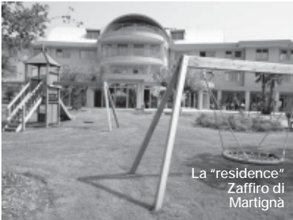
La "residence" Zaffiro di Martignà

Al è presint un grup di professioniscj componût di miedis (miedi di medisine gjenerâl, anestesist, terapist dal dolôr); psicolic; infermîrs; operadôrs sociosanitariis. E je cun di plui previodude la consulenze di altris figuris professionâls in rispueste a esigen-cis specificis e ancje la ativazion des associazions di volontariât.